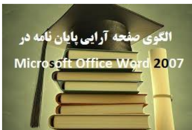
تصویر ۱-۱. نمونه تصویر در فصل یک