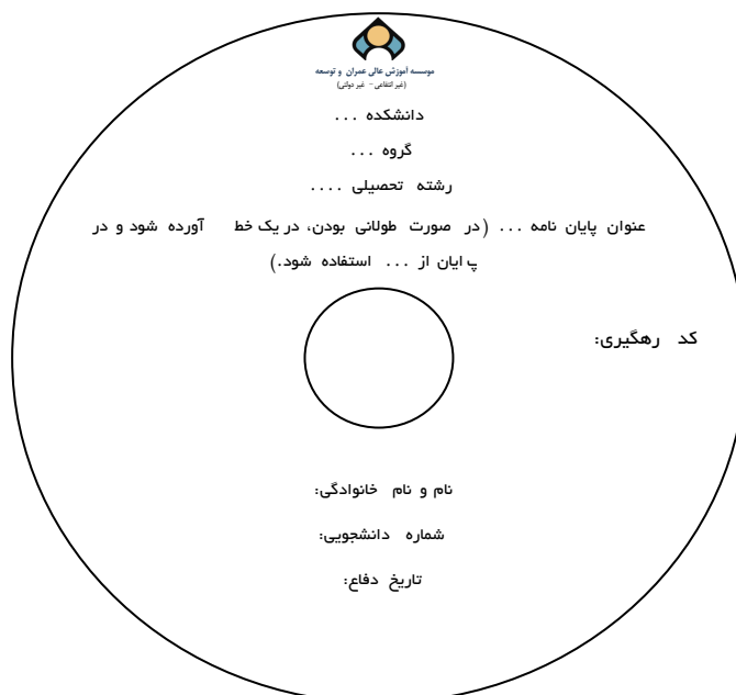
شکل ۱. مشخصات لوح فشرده (cd) تحویلی

تبصره ۳: لوح فشرده دارای مشخصات درج شده مطابق شکل زیر باشد.