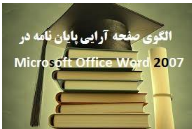
تصویر ۱-۱. نمونه تصویر در فصل یک