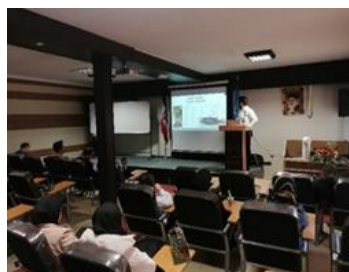
تصاویر جلسات دفاع دانشجویان مقطع کارشناسی ارشد