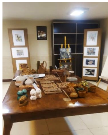
برگزاری نمایشگاه آثار گرافیکی دانشجویان گرافیک و ارتباط تصویری