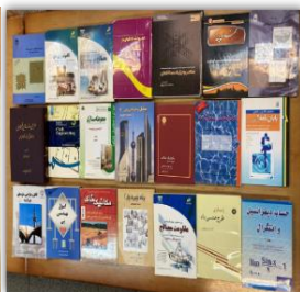
قدردانی از اهداکنندگان کتاب در مراسم هفته پژوهش