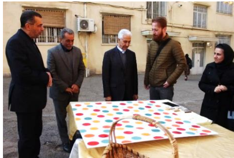
برگزاری چاپ دستی لینو به مناسبت یلدا