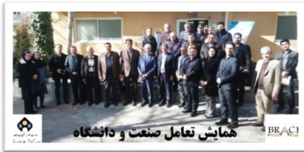
برگزاری همایش تعامل صنعت و دانشگاه

این همایش با هدف تعامل دانشگاه و صنعت و بر اساس ایده اولیه نمایشگاه گروه عمران در تاریخ ۱۴۰۲/۱۰/۱۰، ساعت ۱۱ صبح در دو بخش "سخنرانی" در محل سالن اجتماعات و "نمایشگاه دستاوردهای شرکت دانش بنیان بتن صنعت بريس" در محل کارگاه مؤسسه برگزار شد.