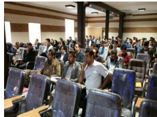
برگزاری دوره‌های نظام مهندسی ساختمان استان همدان