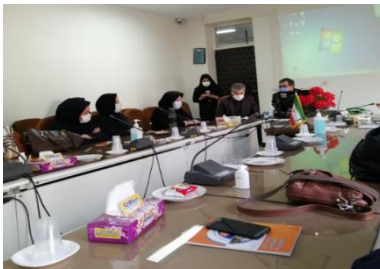
حضور سفیر سلامت مؤسسه در کارگاه آموزشی مرکز بهداشت همدان