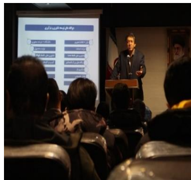
برگزاری مراسم گرامیداشت هفته پژوهش