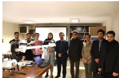
برگزاری نمایشگاه فتوگرامتری یا برد کوتاه